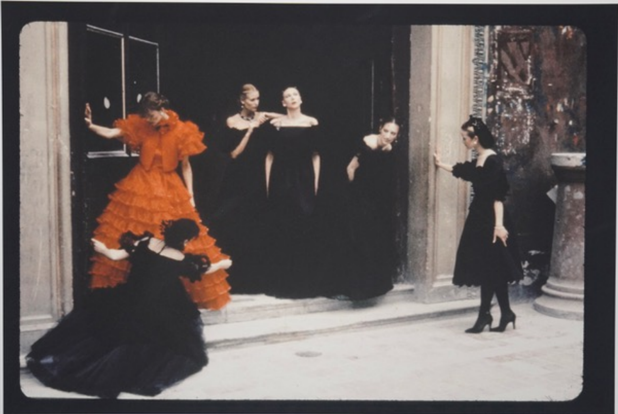
Deborah Turbeville. Untitled (Valentino), Venice, Italy. 1977. Archival pigment Signed on recto 42,5 cm x 55 cm