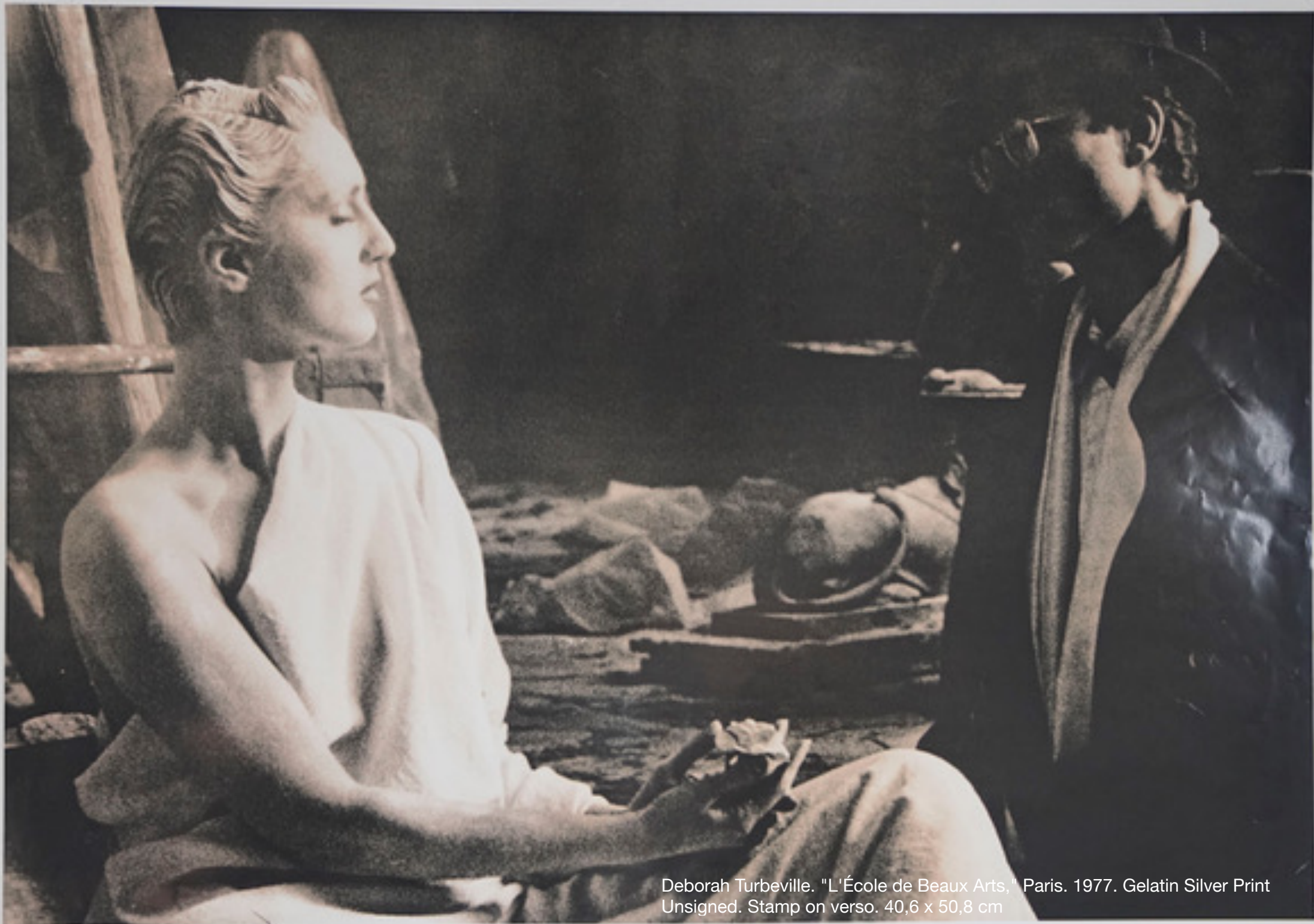
Deborah Turbeville. "L'École de Beaux Arts," Paris. 1977. Gelatin Silver Print Unsigned. Stamp on verso. 40,6 x 50,8 cm