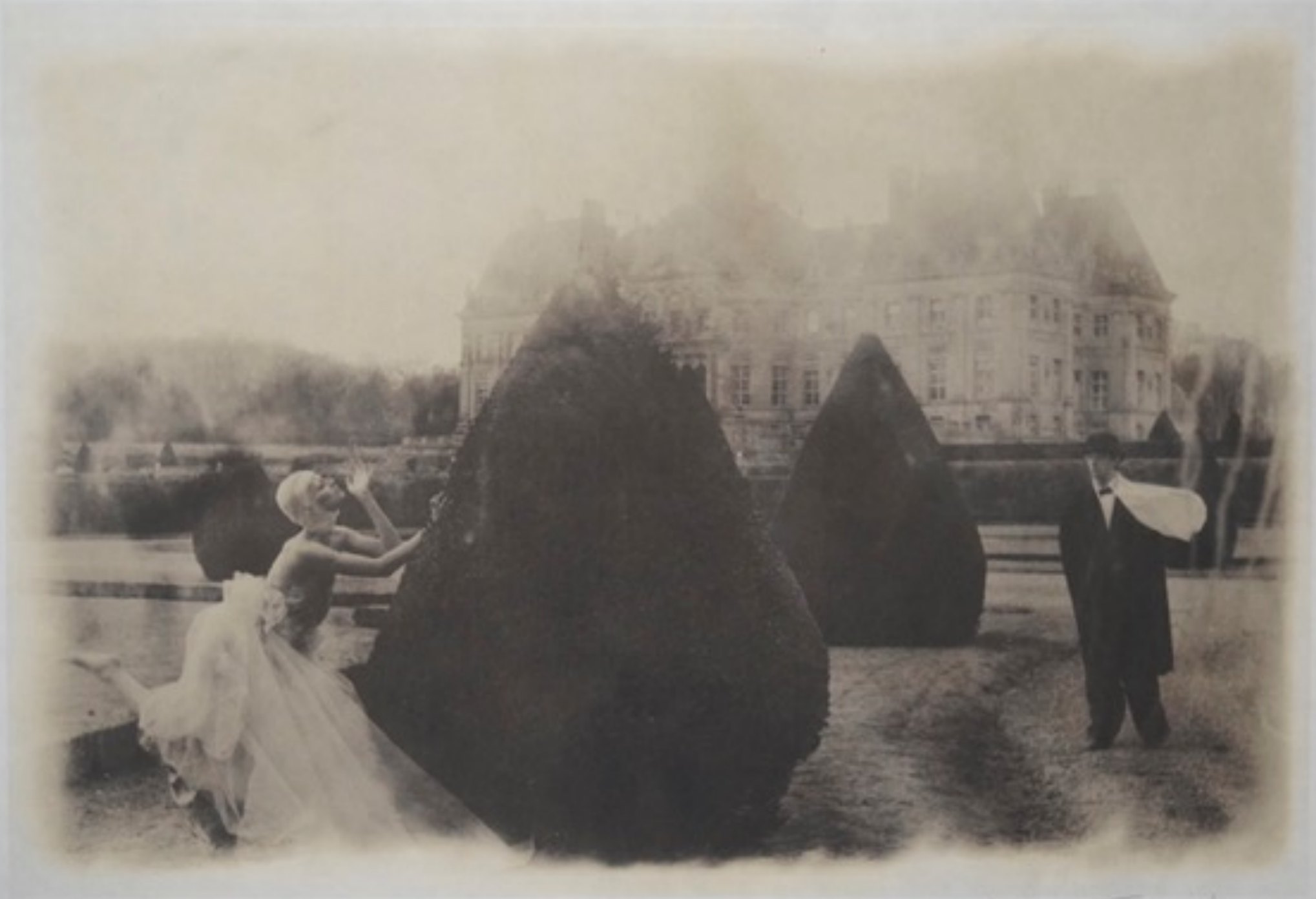
Deborah Turbeville. Untitled (Rosima in Comme des Garçons. The garden at Château de Vaux-le-Vicomte), Paris, France. 1985. Inkjet Print. Signed on recto. 45,5 cm x 57,5 cm