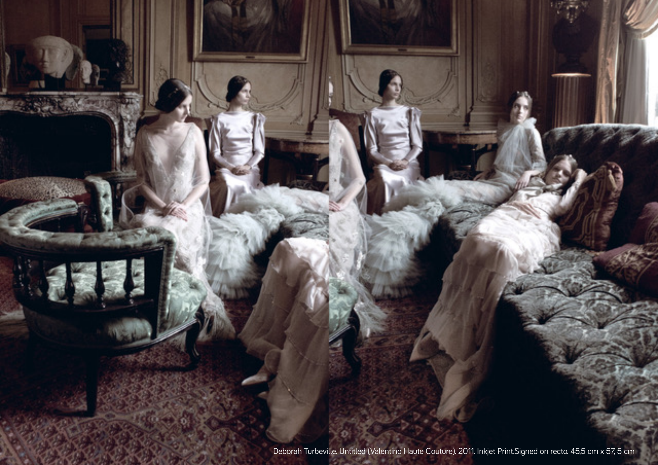
Deborah Turbeville. Untitled (Valentino Haute Couture). 2011. Inkjet Print. Signed on recto. 45,5 cm x 57,5 cm