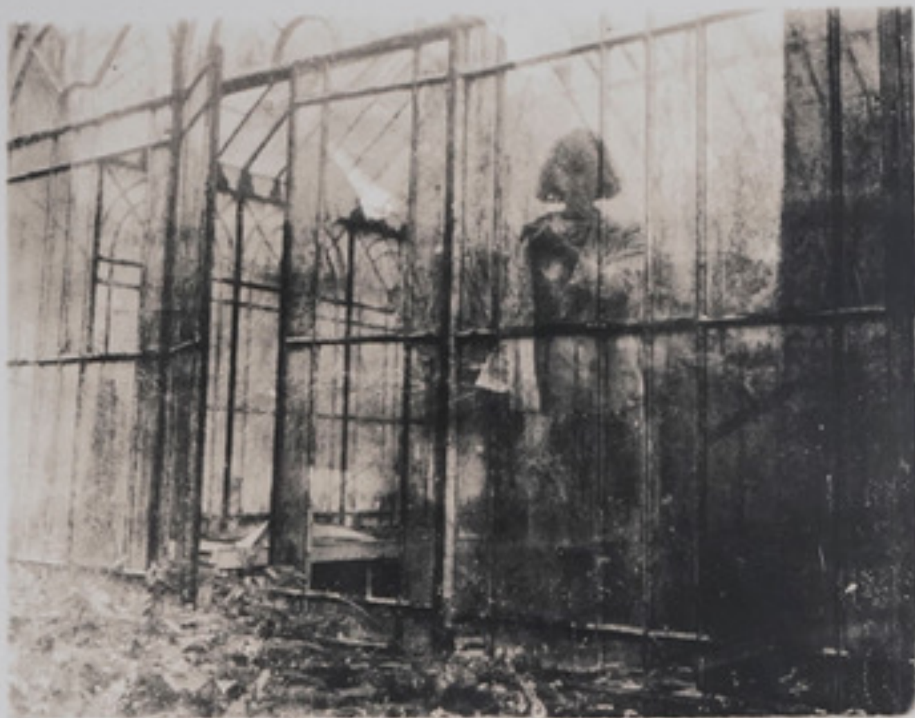
Deborah Turbeville. Untitled. 1981. Gelatin Silver Print Unsigned. Stamp on verso. 22 cm x 18 cm (image) 40,5 cm x 51 cm (paper)