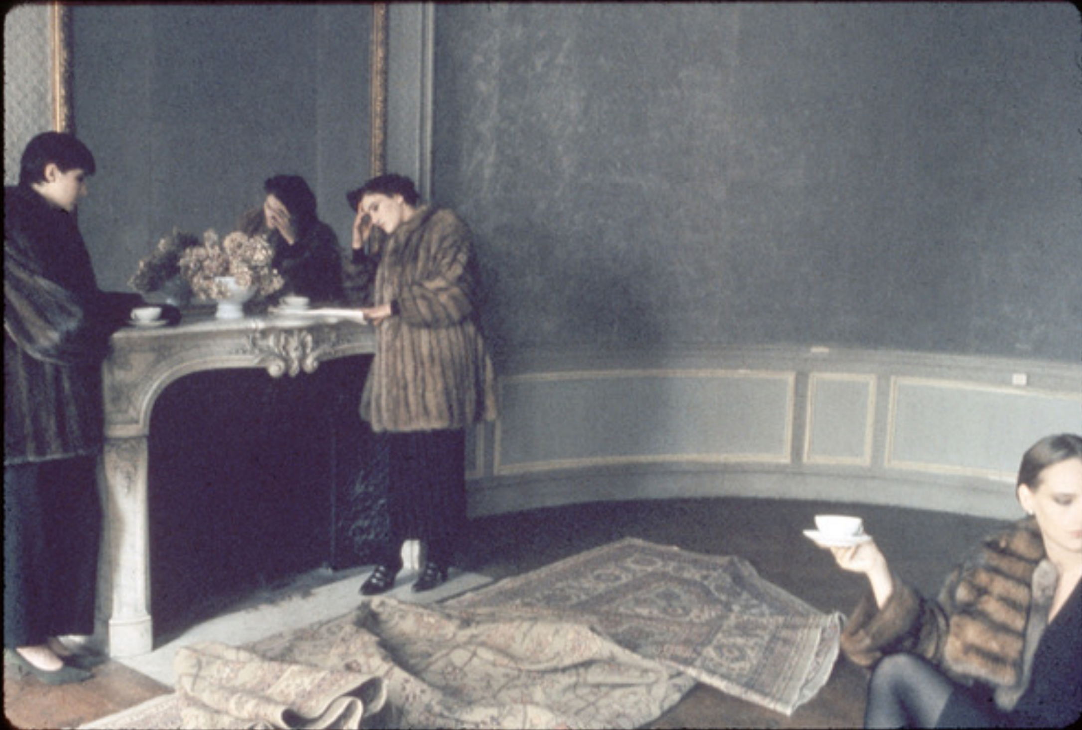
Deborah Turbeville. Paris, from the series "Women in Furs". 1984. Inkjet Print Signed on recto. 50,8 cm x 61 cm