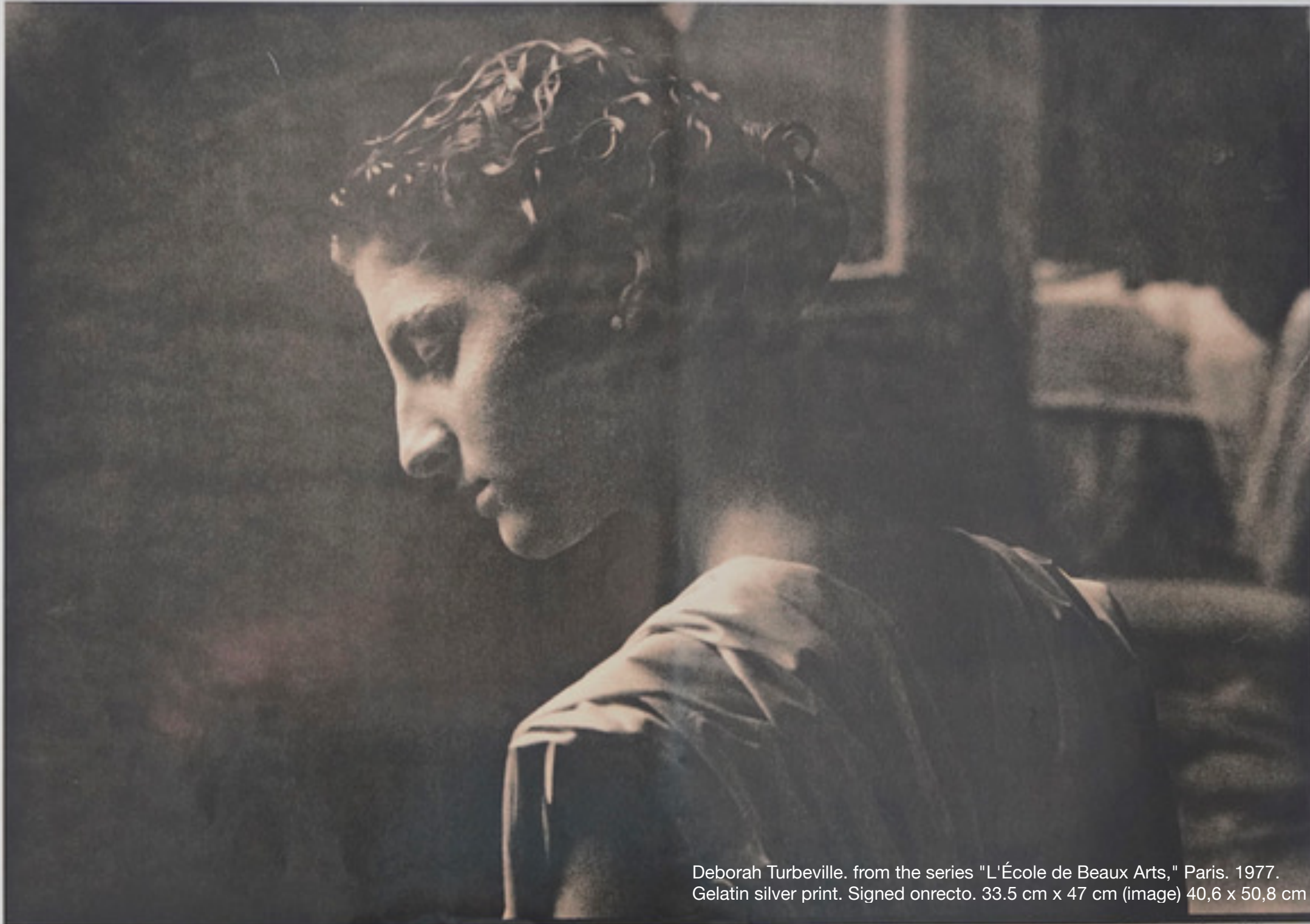
Deborah Turbeville. from the series "L'École de Beaux Arts," Paris. 1977. Gelatin silver print. Signed on recto. 33.5 cm x 47 cm (image) 40,6 x 50,8 cm