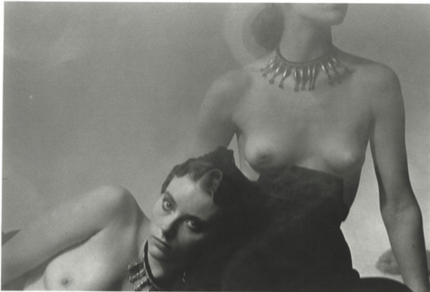
Deborah Turbeville. Untitled, from de series "Women of the Steam Bath," New York. 1984. Gelatin silver print. Unsigned. Stamp on verso. 20 cm x 25 cm (paper)