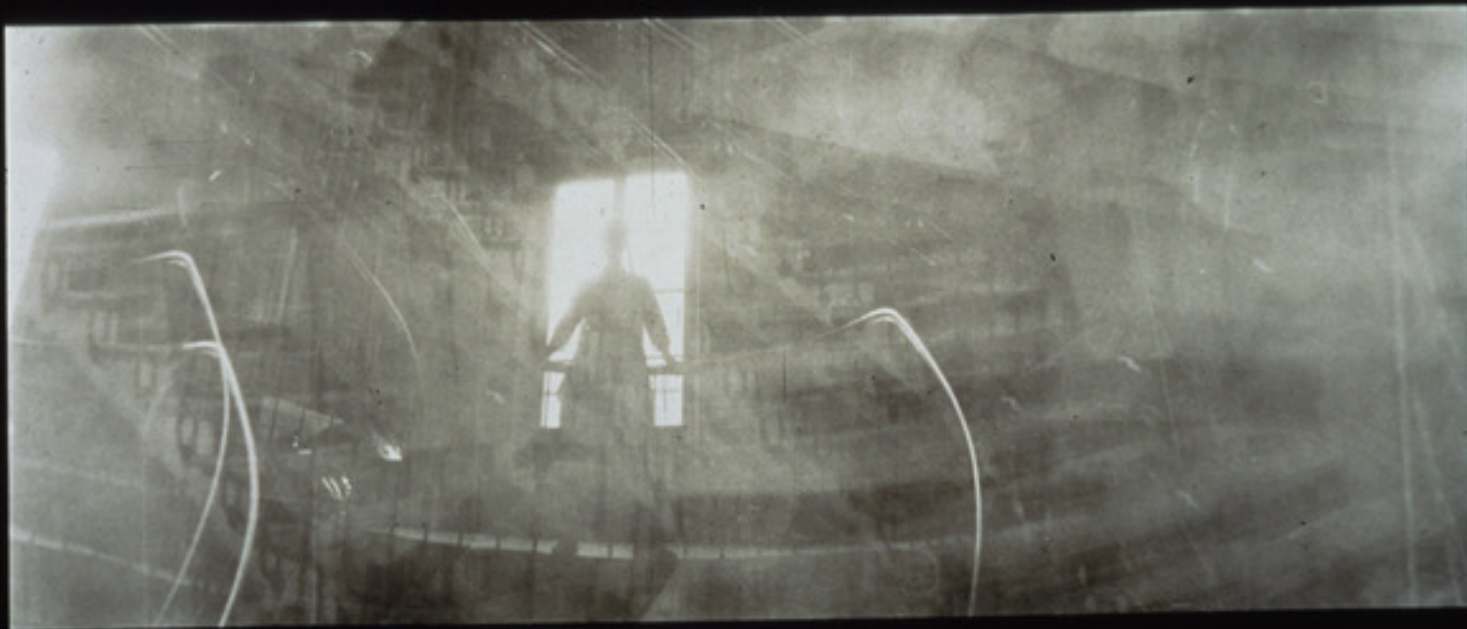
Deborah Turbeville. November 24, 1980, from de series "Commes des Garcons," Paris, 1980. Gelatin Silver Print. Inscribed on recto: "November 23, 1980". 20 cm x 45,5 cm (image). 40,5 cm x 51 cm (paper)