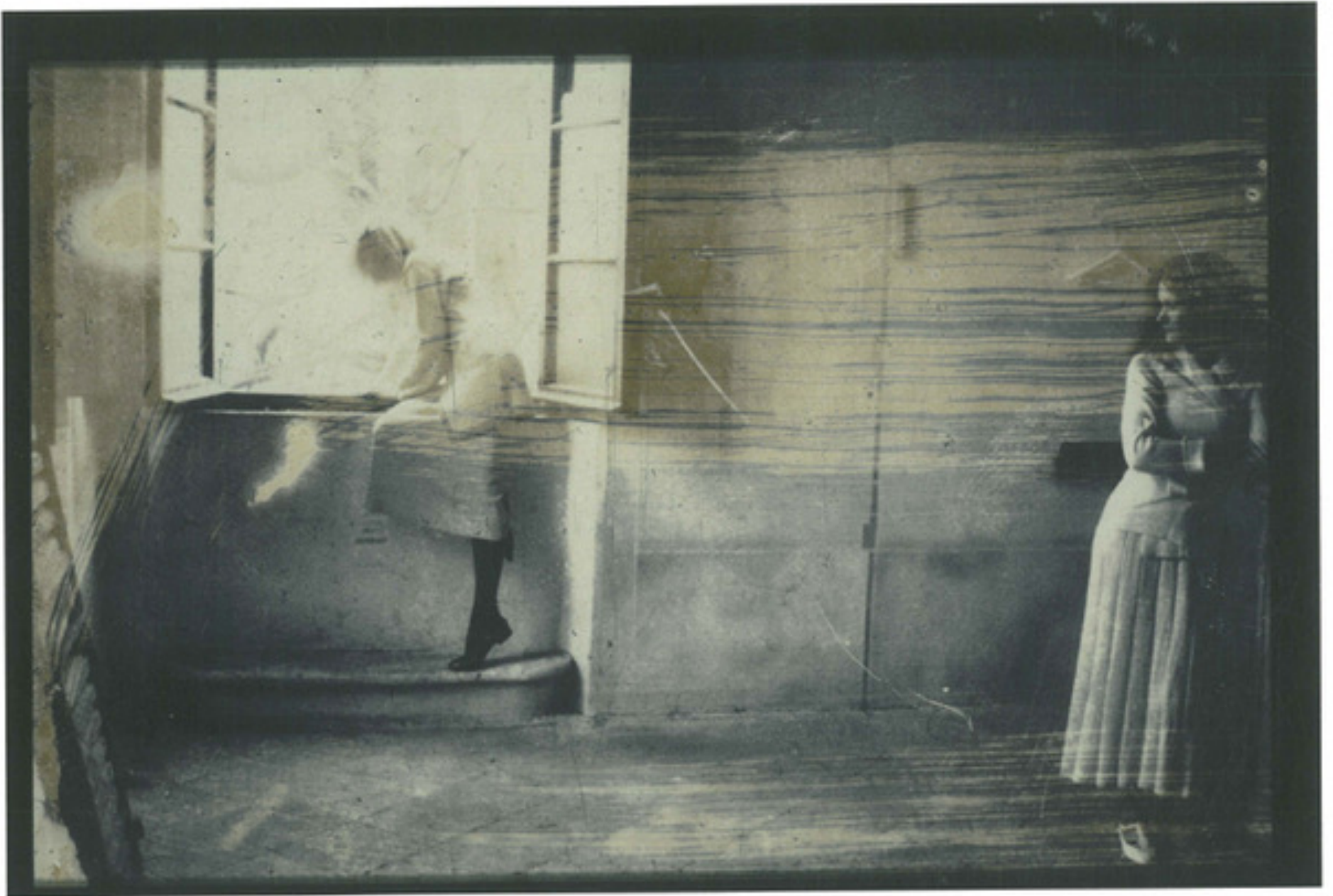
Deborah Turbeville. Untitled, from the series "L'Heure Entre Chien et Loup," Mantua, Italy, 1977. Inkjet Print Unsigned. Stamp on verso. 20 cm x 27 cm