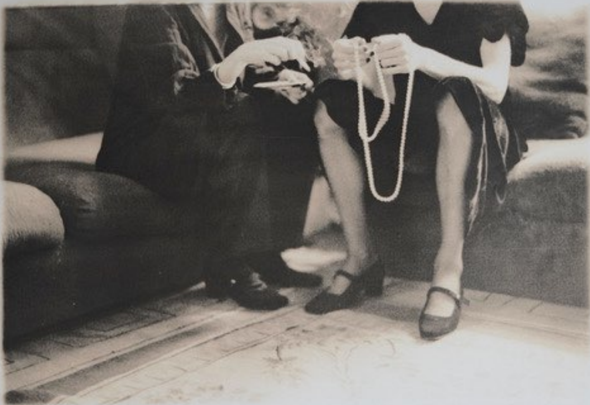
Deborah Turbeville. Alice Beebee / Sarah Cunio Jean Paul Baujard's apartment. Gelatin Silver Print. Unsigned. Stamp on verso. 40,5 cm x 51 cm