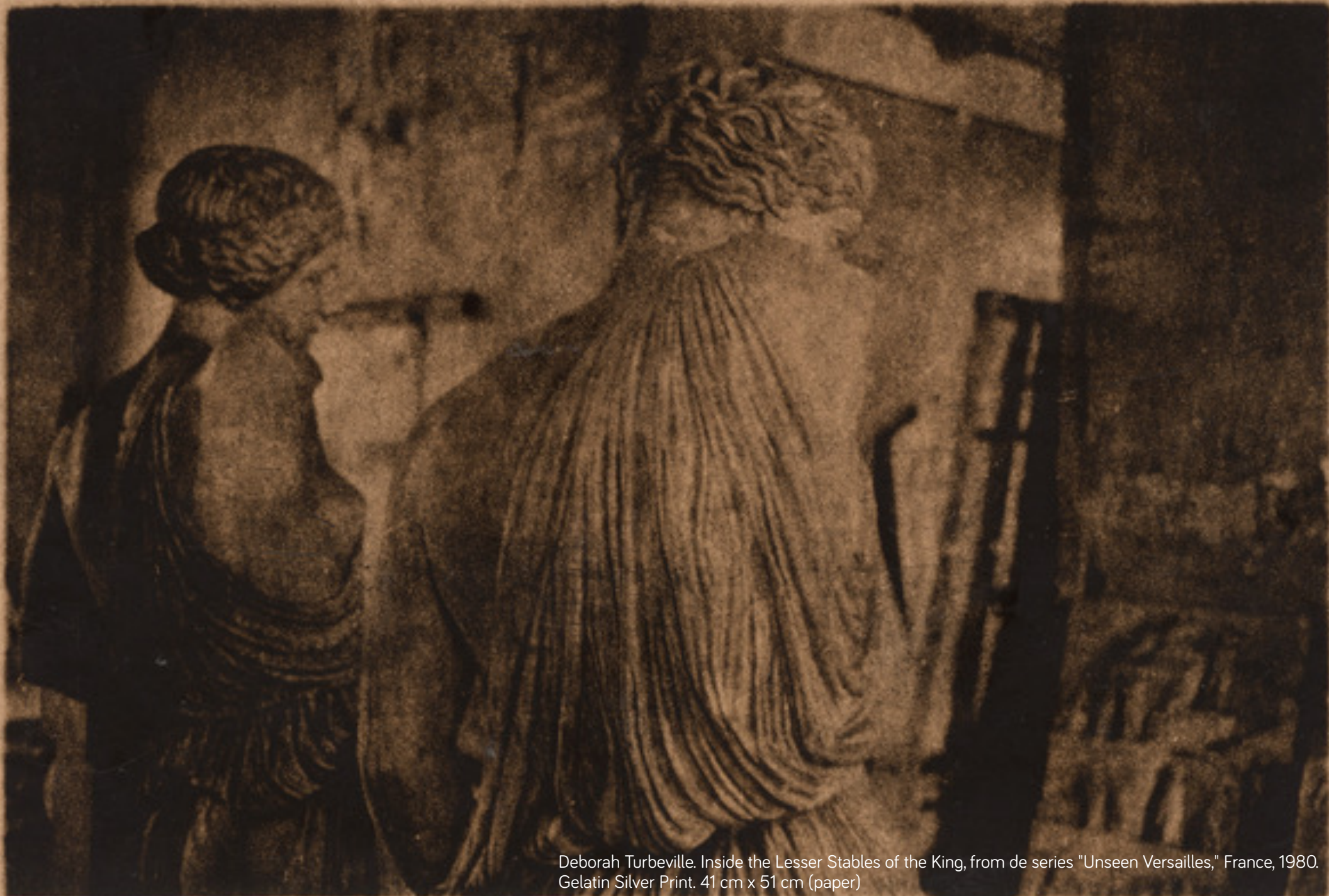
Deborah Turbeville. Inside the Lesser Stables of the King, from de series "Unseen Versailles," France, 1980. Gelatin Silver Print. 41 cm x 51 cm (paper)