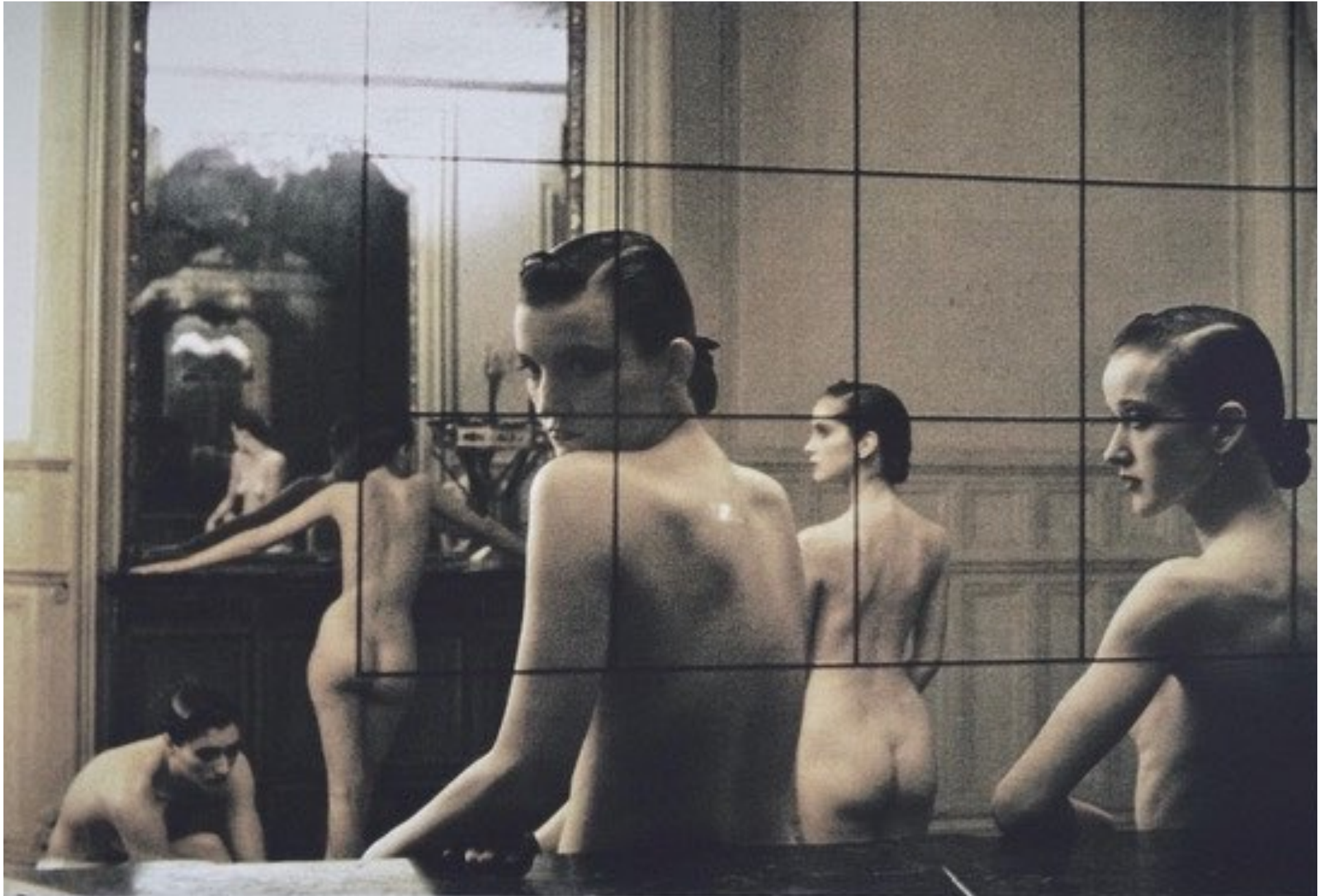
Deborah Turbeville. Untitled (Nudes), form de series "Pigalle", France. 1982. Archival pigment print Unsigned. Stamp on verso. 51,5 cm x 71 cm