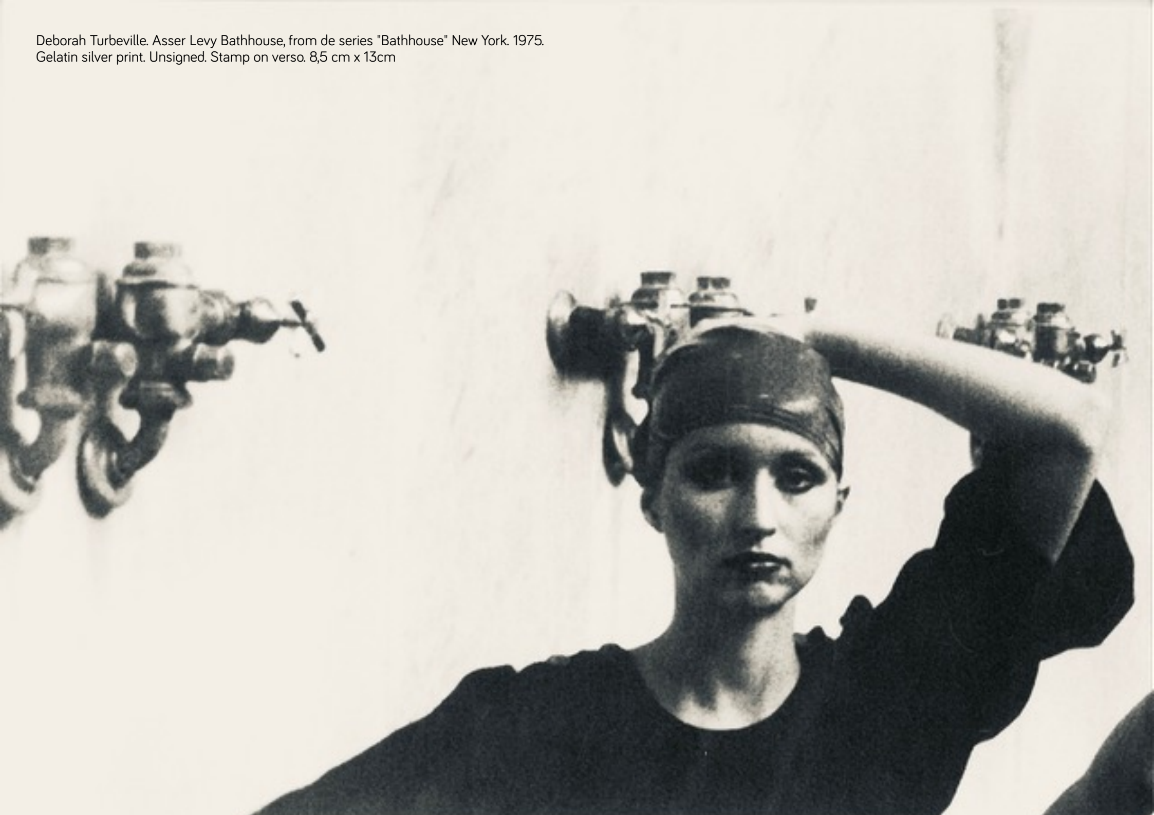
Deborah Turbeville. Asser Levy Bathhouse, from de series "Bathhouse" New York. 1975. Gelatin silver print. Unsigned. Stamp on verso. 8,5 cm x 13cm