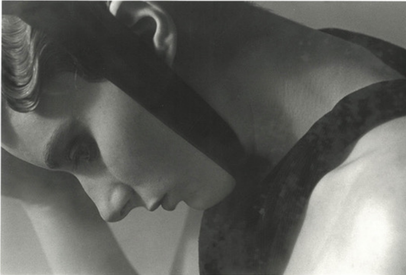
Deborah Turbeville. Untitled, from de series "Women of the Steam Bath," New York. 1984. Gelatin silver print Unsigned. Stamp on verso. 20 cm x 25 cm