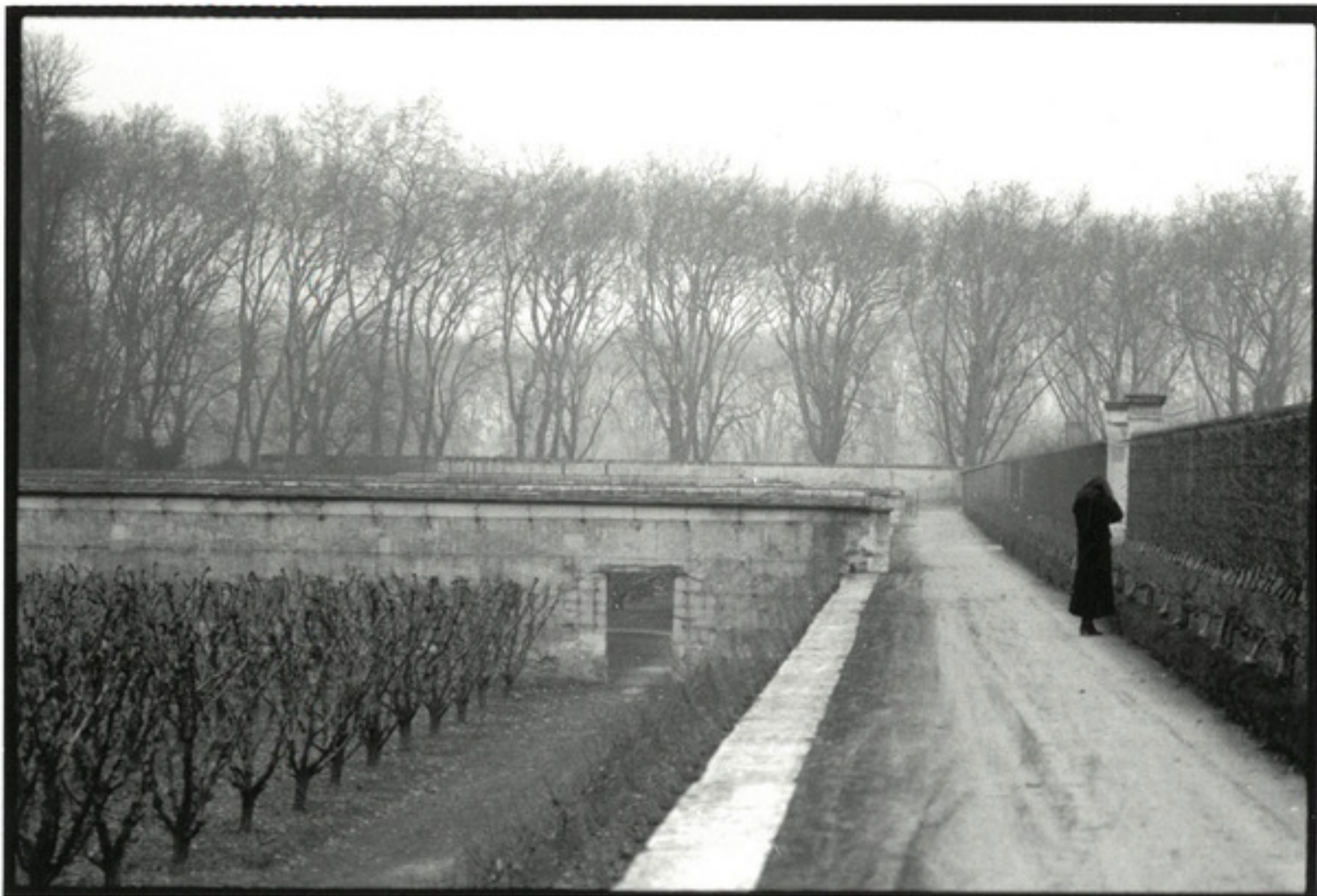
Deborah Turbeville. At Versailles, from the series "Unseen Versailles". 1980. Gelatin silver print Unsigned. Stamp on verso. 13 cm x 18 cm