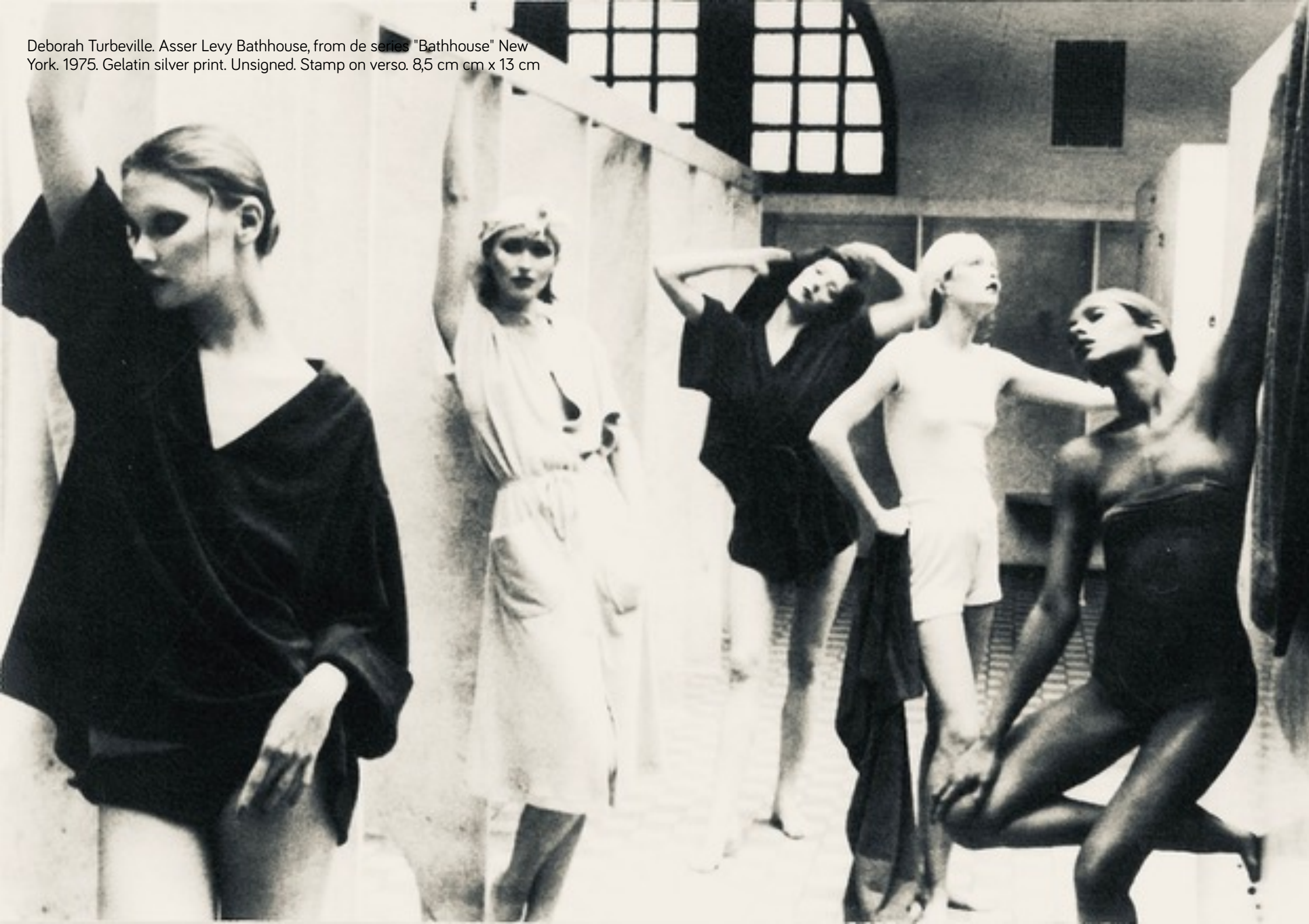
Deborah Turbeville. Asser Levy Bathhouse, from de series "Bathhouse" New York. 1975. Gelatin silver print. Unsigned. Stamp on verso. 8,5 cm cm x 13 cm