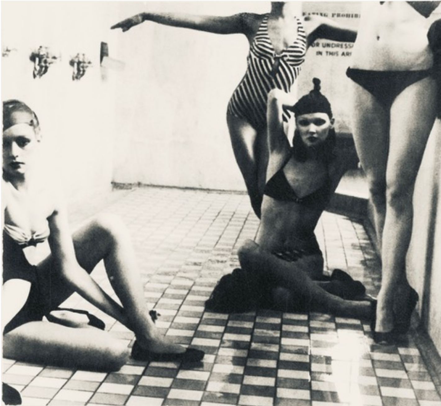
Deborah Turbeville. Asser Levy Bathhouse, from de series "Bathhouse" New York. 1975. Gelatin silver print. Unsigned. Stamp on verso. 8,5 cm x 9,5cm