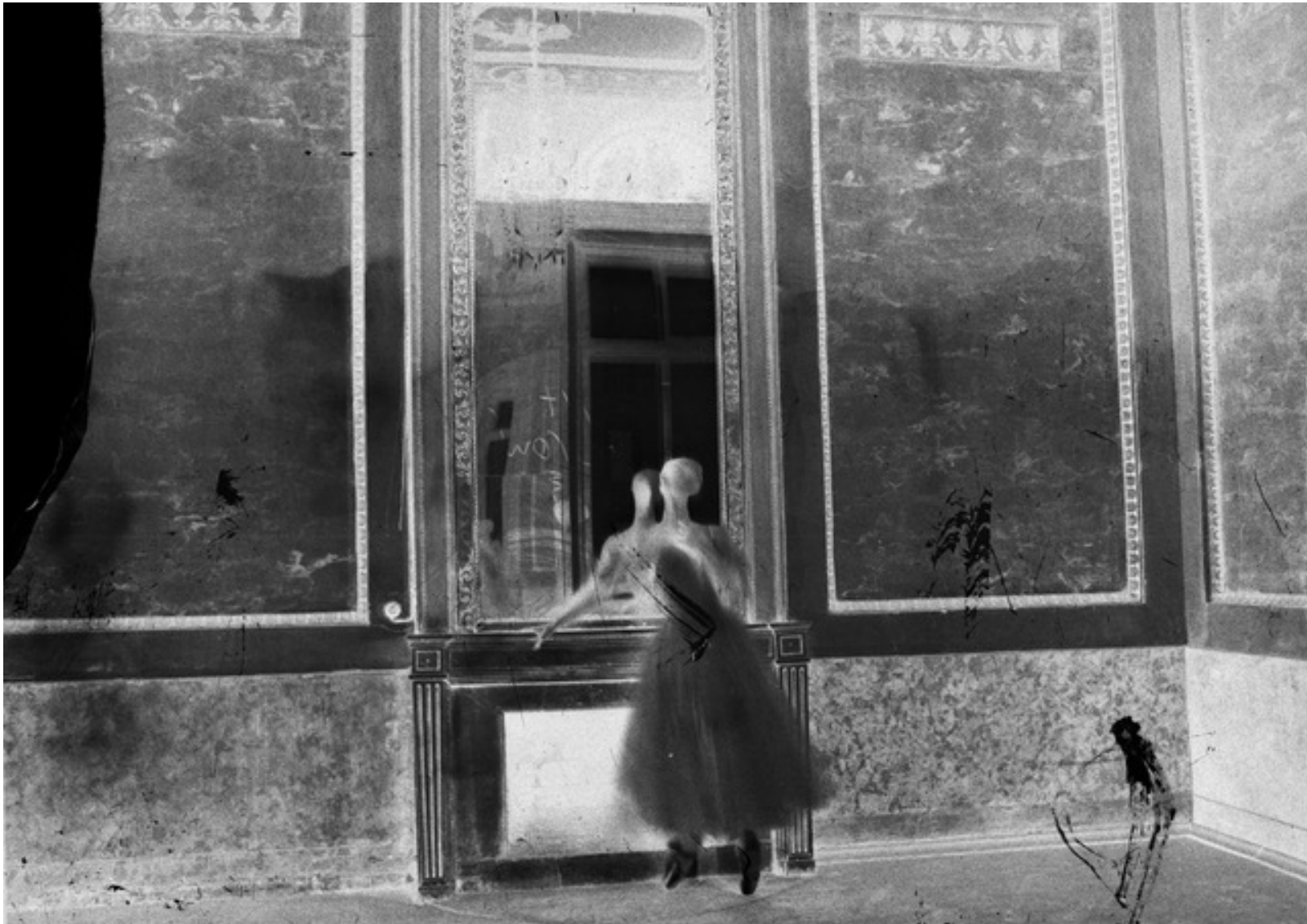
Deborah Turbeville. Untitled, from de series "Studio St. Petersburg," Saint Petersburg, Russia. (1995-1996). Inkjet print. 37 cm x 48 cm