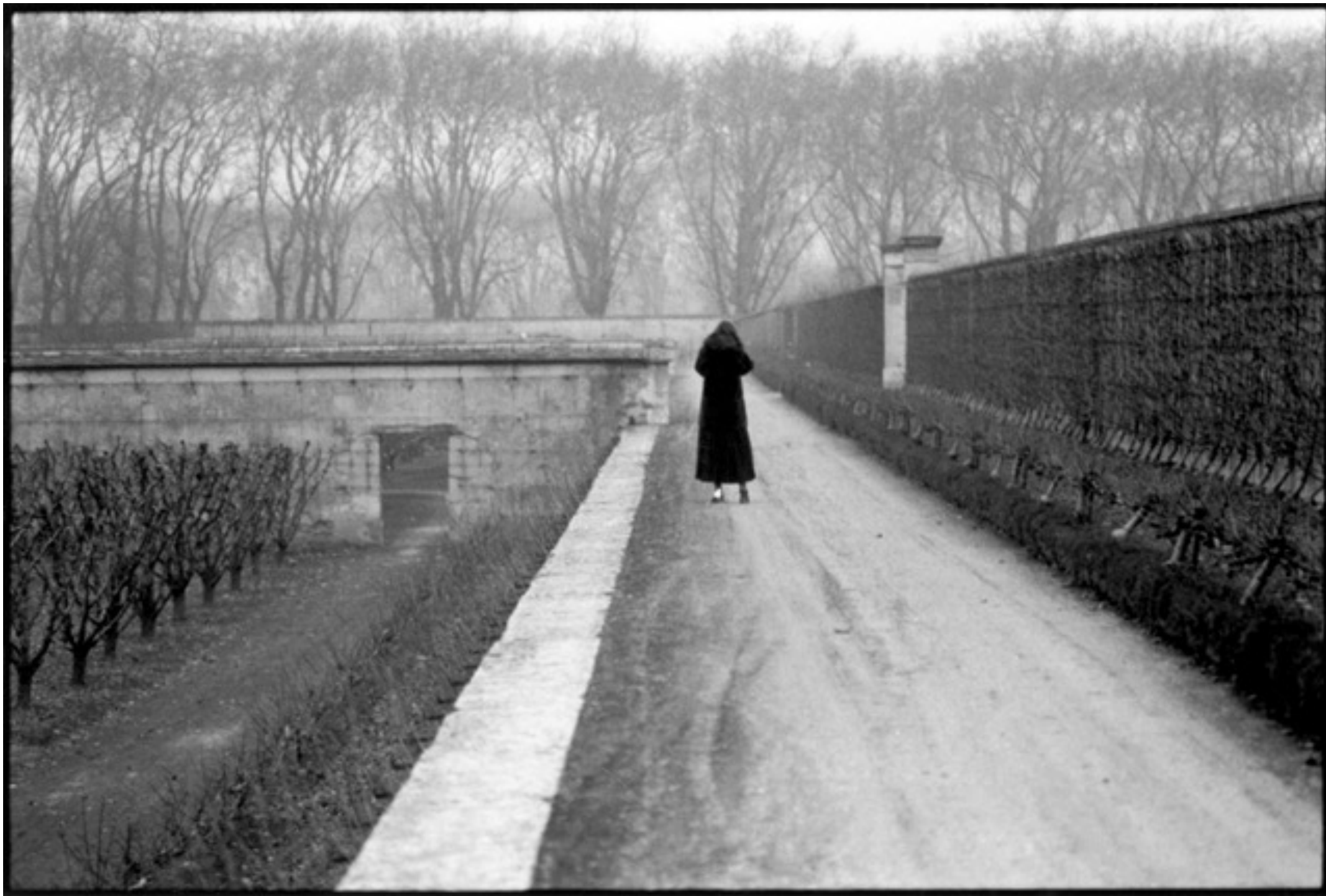
Deborah Turbeville. At Versailles, from the series "Unseen Versailles". 1980. Inkjet print Unsigned. Stamp on verso. 40,6 x 50,8 cm (paper)