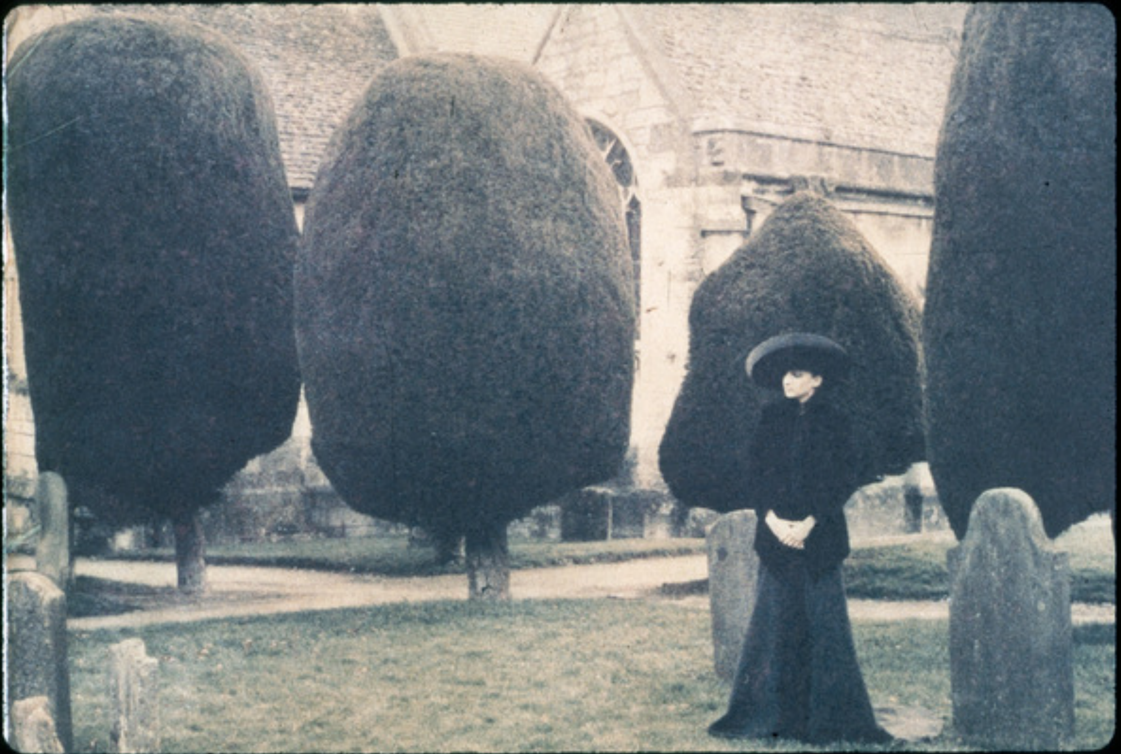
Deborah Turbeville. L'uomo Vogue: Paibnswick, England. 1992. Inkjet print Signed on recto 42,5 cm x 57,5 cm