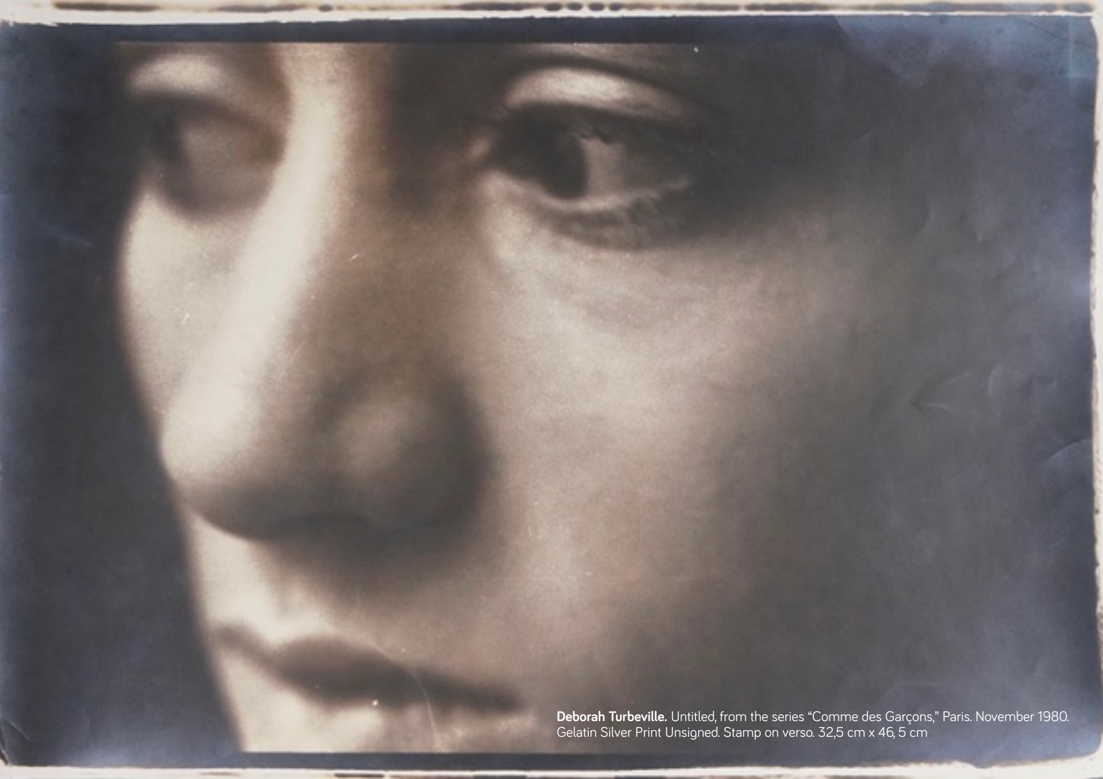
Deborah Turbeville. Untitled, from the series "Comme des Garçons," Paris. November 1980. Gelatin Silver Print Unsigned. Stamp on verso. 32,5 cm x 46,5 cm