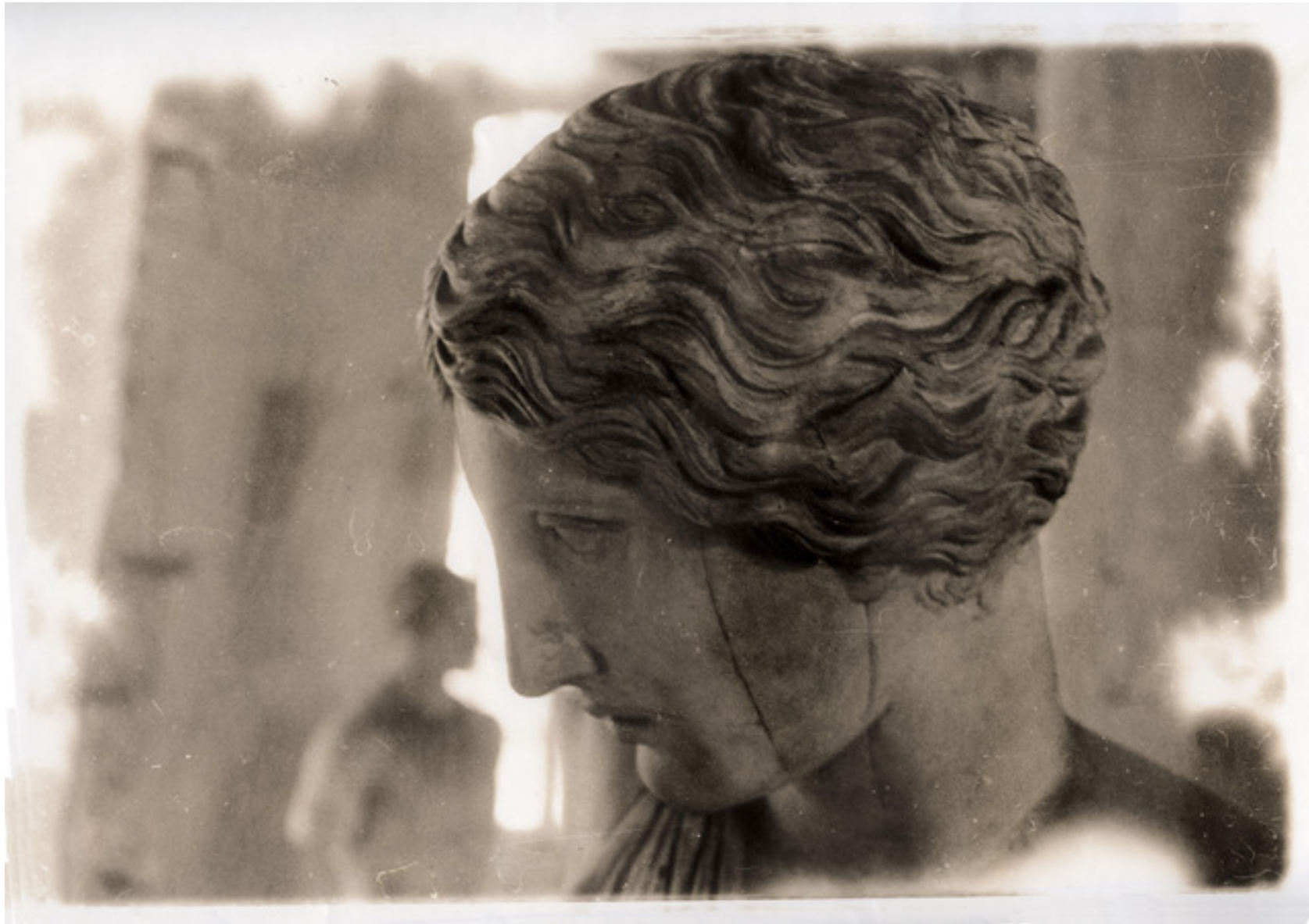
Deborah Turbeville. Inside the Lesser Stables of the King, from de series "Unseen Versailles," France, 1980. Inkjet Print. Signed on recto lower right corner pencil. Printed on watercolor paper. 47,5 cm x 67 cm